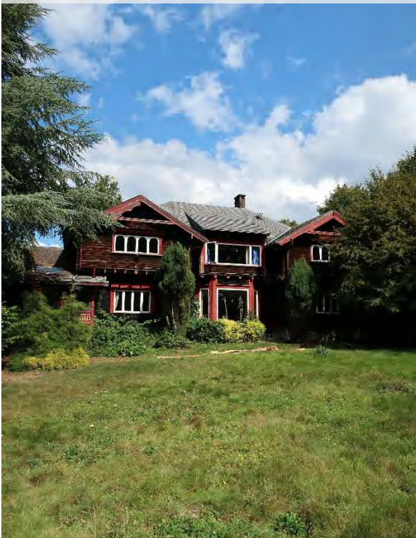
Chalet norvégien de Loverval (fabriqué par Strømmen Trævarefabrik) Ancienne propriété de la famille Capart

Pour cette 9 ème édition, deux prix ont été attribués dans deux catégories distinctes. Le premier est destiné aux titulaires d'un diplôme de Master en histoire de l'art, archéologie, architecture, architecture paysagère, architecture d'intérieur ou d'ingénieur-architecte alors que le second est réservé à des jeunes diplômés dans le cadre du « Master de spécialisation en Conservation et Restauration du Patrimoine culturel immobilier » organisé conjointement par les cinq universités francophones (UCLouvain, ULB, ULiège, UMon, UNamur) et la Haute Ecole Charlemagne.