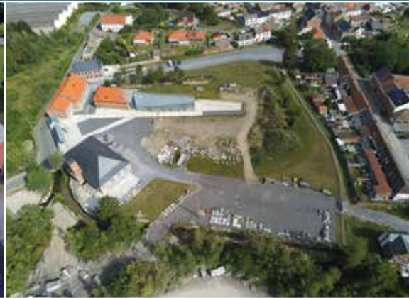
Vue aérienne du Pôle de la Pierre à Soignies