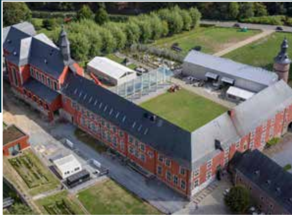
Vue aérienne du Centre des Métiers du Patrimoine « la Paix-Dieu » à Amay.