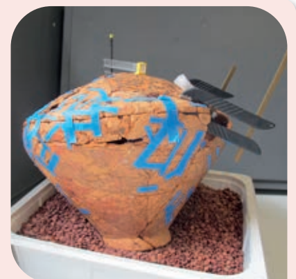
Céramique en cours de restauration.

Muriel DE POTTER, avec la collaboration de Véronique DANÈSE, Frédéric HANUT, Valentine DE BEUSSCHER, Hélène BLANPAIN et Isabelle DERAMAIX.