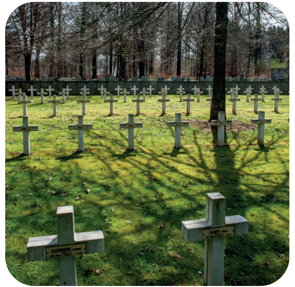
Cimetière du Radan, Tintigny.