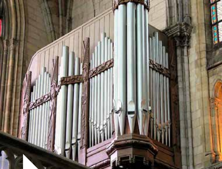
Orgue, Arlon