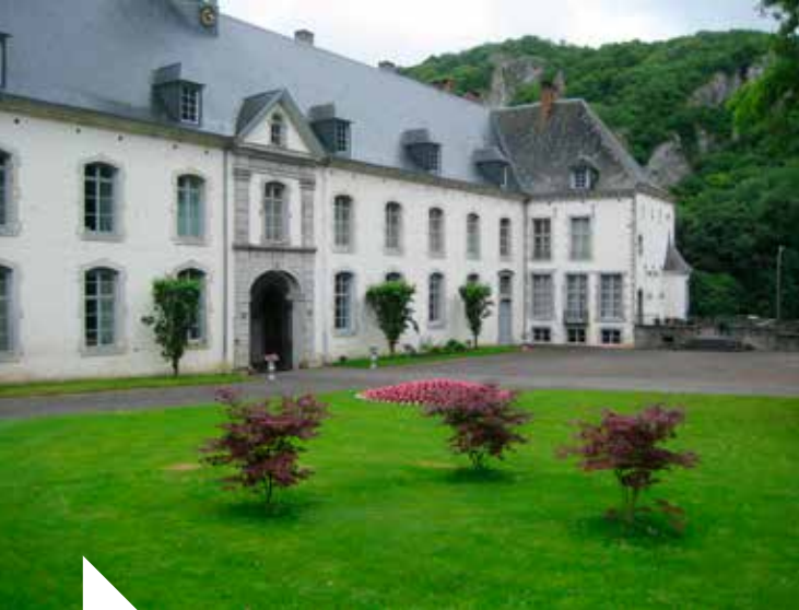
Ch. Maes © OT Hastière