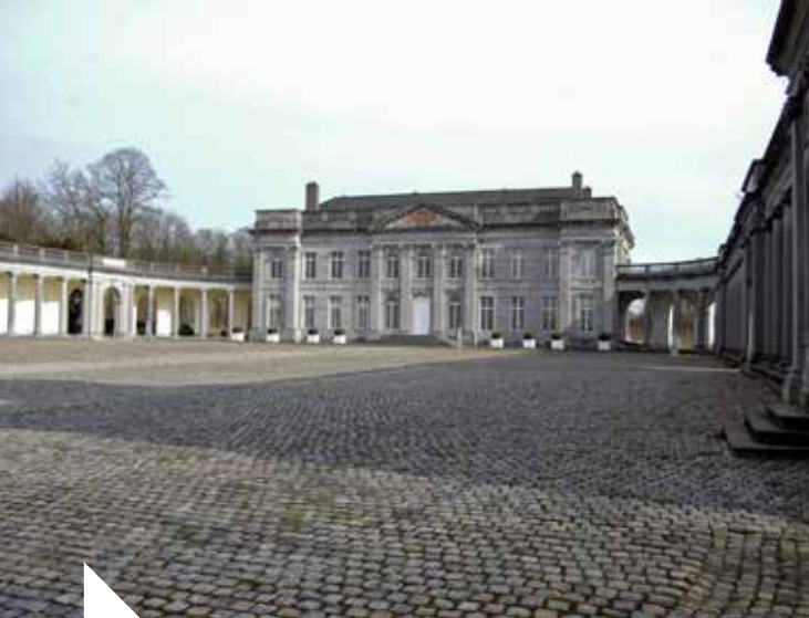
R. Rouer © Domaine de Seneffe