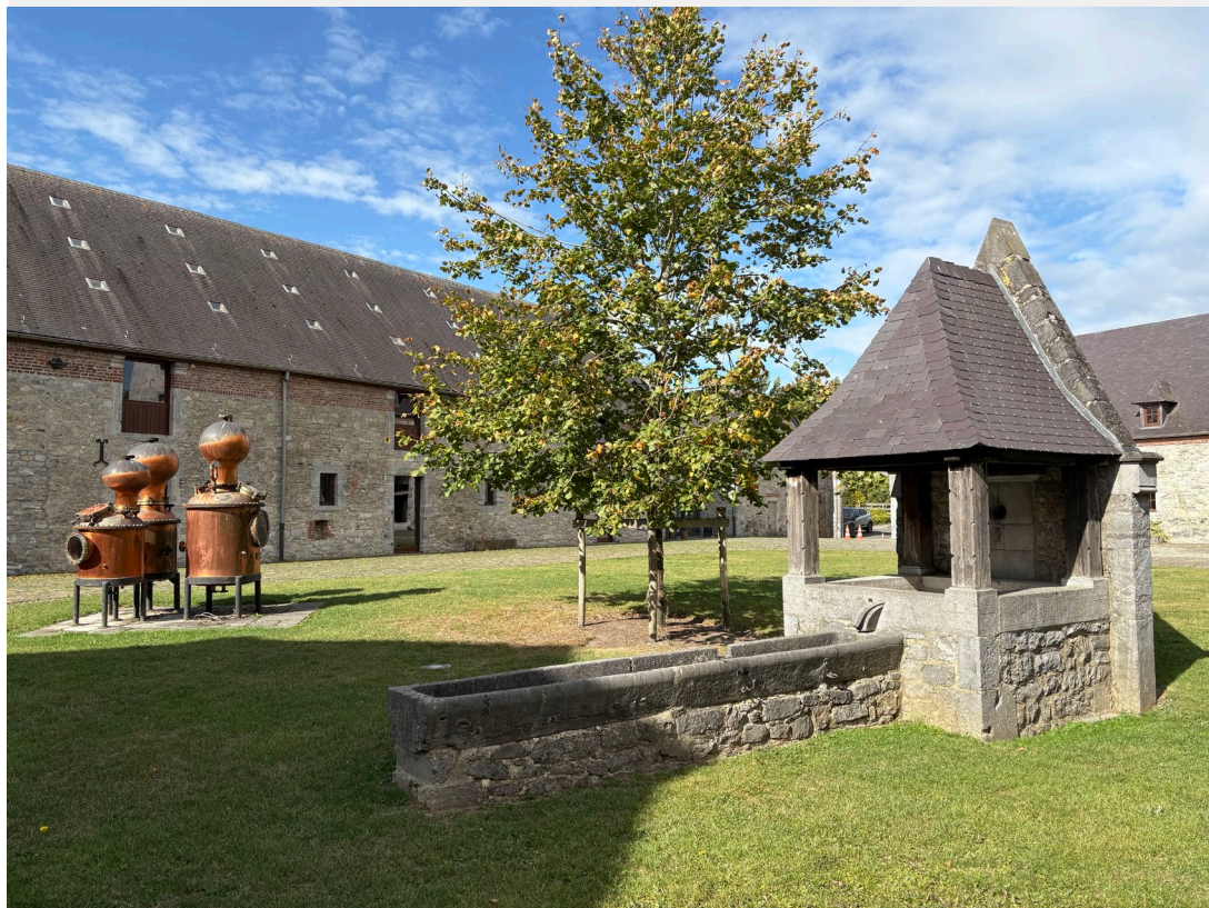
Distillerie de Biercée, Thuin.