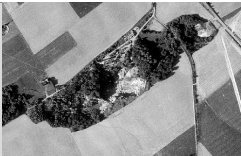
1994 : la carrière n'est plus exploitée et entreprise installée sur la parcelle contigue, hors site classé