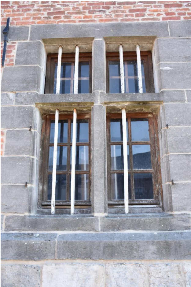
Détail d'une fenêtre au rez-de-chaussée. Noter que le linteau est d'une seule pièce, contrairement à l'appui et à la traverse. A mettre en lien avec la datation « tardive » ?