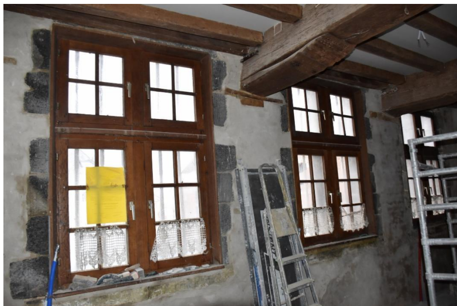
Rez-de-chaussée, pièce à gauche de l'entrée (trois fenêtres séparées par un trumeau côté place ; sommiers perpendiculaires à la façade)