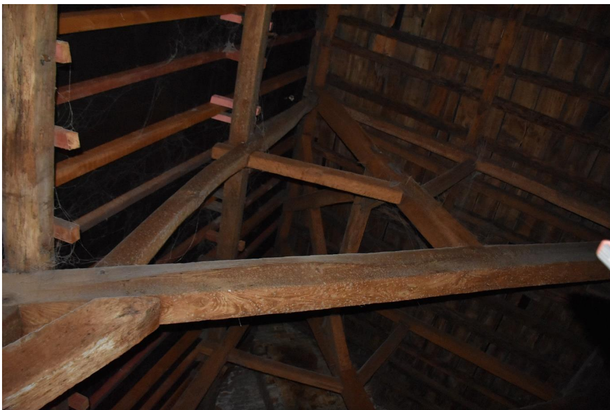
Charpente sur la partie droite (pignon contre maison voisine)