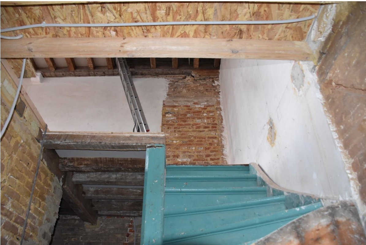
Cage d'escalier (pas d'intérêt patrimonial)