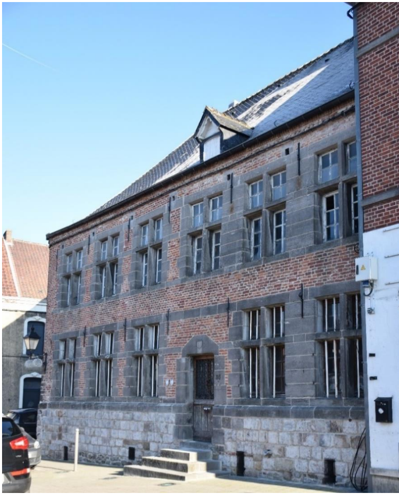
Vue d'ensemble de la façade principale vers la Place.