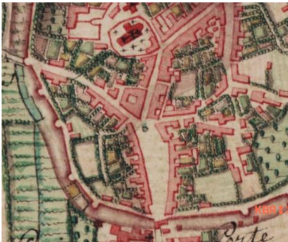
Carte de Ferraris (1770-1778)

Ce plan n'apporte pas de précision concernant le bâtiment qui devait encore être la halle de cette petite ville-marché. En face, la première maison de ville (ex- Maison de Pierre) se signale par une toiture en ardoises. La place proprement dite était plus ramassée qu'actuellement, bornée par un abreuvoir, bien visible sur le plan.