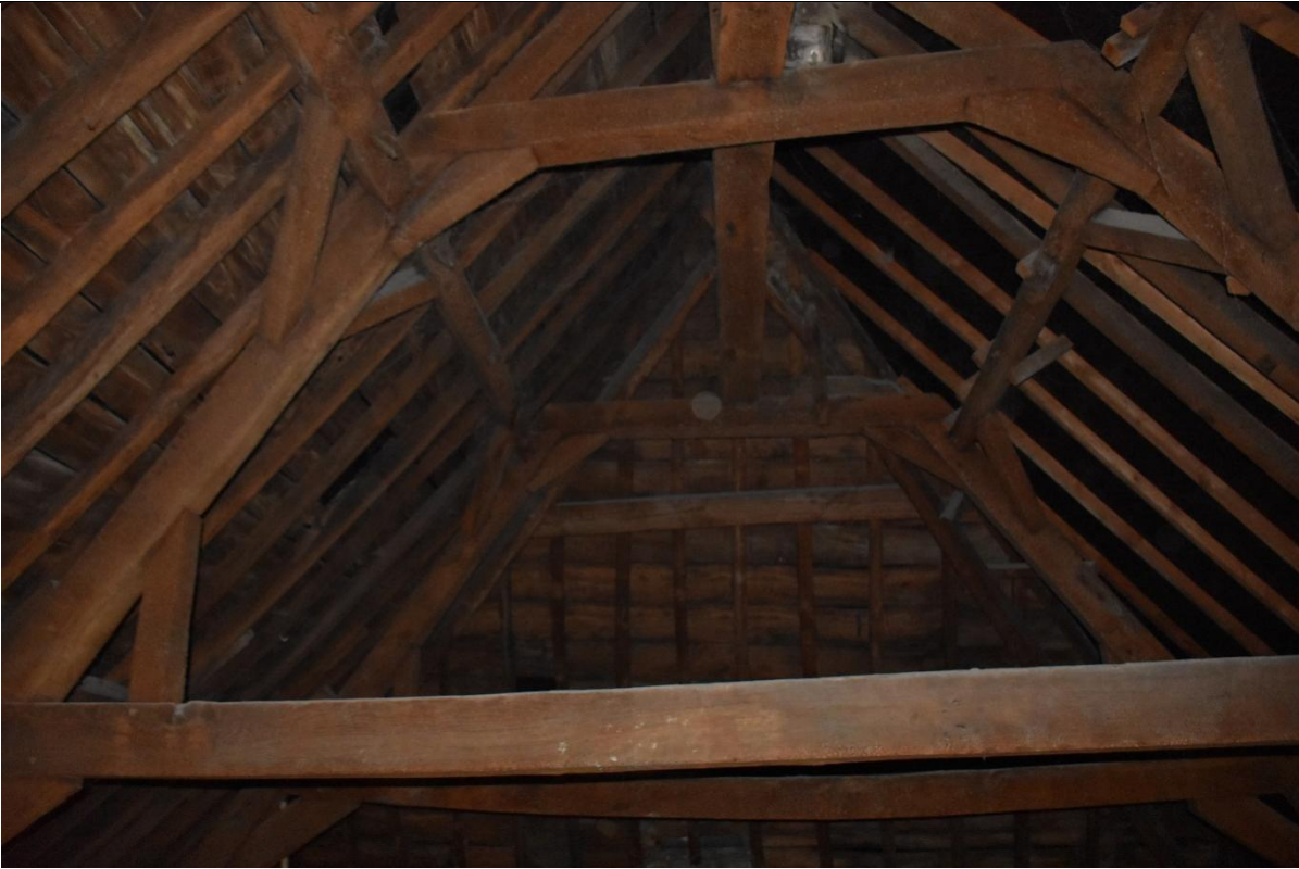
Charpente sur la partie à croupe latérale.