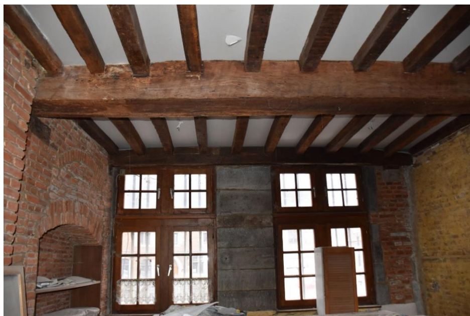
Rez-de-chaussée, pièce à droite de l'entrée (deux fenêtres jointives côté place ; sommiers parallèles à la façade)

Contrairement à ce que laisse penser une façade d'allure homogène, l'immeuble comprend deux parties distinctes : à gauche de l'entrée, à chacun des deux niveaux, une pièce de trois travées, dont les poutres du plafond sont perpendiculaires à la façade ; à droite, une petite pièce moins profonde et suivie d'un réduit, éclairée par deux fenêtres et couverte par trois sommiers placés quant à eux parallèlement à la façade. Chacune de ces pièces étaient chauffée par une cheminée adossée au mur-pignon, cheminée ayant disparu dans la grande pièce. Comme le mur-pignon libre conserve une porte murée, il est probable que les deux parties aient eu chacune une entrée séparée à une certaine époque.