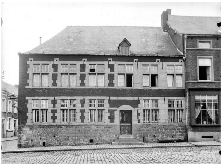
état vers 1917-1918.