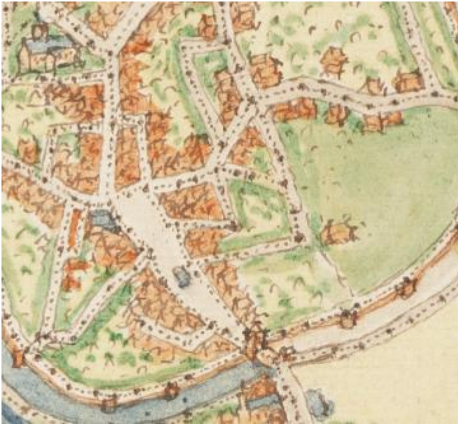
Plan J. de Deventer (3 e quart 16 e s.)

Ce plan n'apporte pas de précision concernant le bâtiment qui devait encore être la halle de cette petite ville-marché. En face, la première maison de ville (ex- Maison de Pierre) se signale par une toiture en ardoises. La place proprement dite était plus ramassée qu'actuellement, bornée par un abreuvoir, bien visible sur le plan.