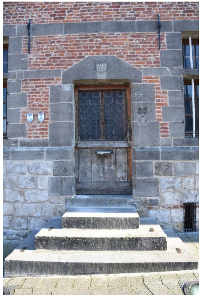
Détail de la porte d'entrée, millésimée 1727 dans un écu saillant sur le linteau en bâtière tronquée.

Cette datation tardive (1727), alors que les traits architecturaux (soubassement saillant, baies à division, porte trapue à congés pyramidaux, etc.) renvoient davantage au 17 e siècle, peut surprendre. Mais elle est plausible, si l'on se réfère à la surface plus grande des jours apportant un éclairage plus généreux et à la régularité de la disposition. C'est là une caractéristique de l'évolution dans le temps de ce type d'architecture vernaculaire. Dans la même entité, le logis de la Ferme de la Court à Mignault a encore des croisées aux fenêtres alors qu'elle est généralement datée de 1743. Par contre, la maison du Chapelain au Roeulx, ancienne conciergerie du château, datée de 1727-1728, est déjà de type tournaisien et davantage influencée par le classicisme français. Plusieurs formules peuvent donc coexister à la même époque sur un même territoire, selon le goût du propriétaire pour la modernité ou la tradition.