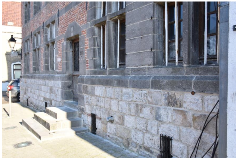
Soubassement saillant terminé par un chanfrein faisant retour de part et d'autre de la porte ; ouvertures de cave et dégorgeoir.

Au début de la Grand'Place, formant l'angle avec la rue d'Houdeng, l'immeuble classé, d'un volume harmonieux, présente une façade de type traditionnel qui séduit par l'homogénéité et la bonne conservation de ses 6 travées de baies à division de pierre calcaire, au-dessus d'un haut soubassement en gros moellons assisés de grès dur, terminé par un chanfrein en calcaire.